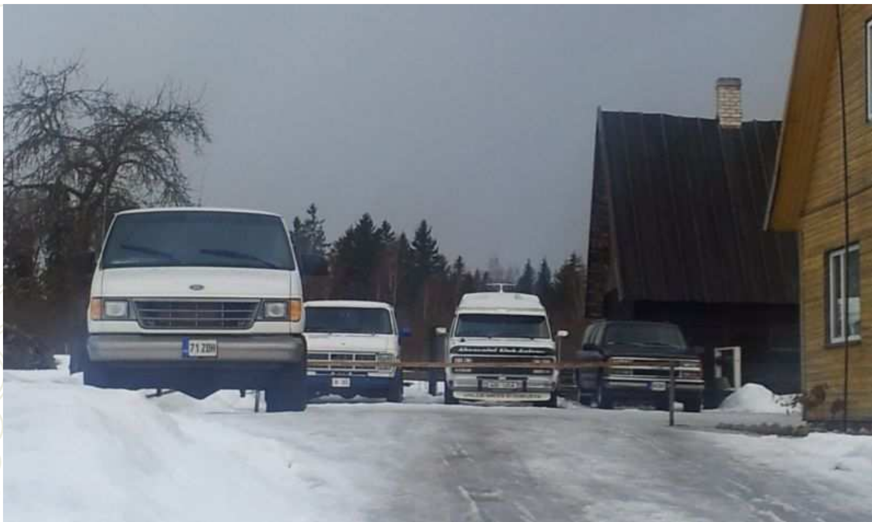
Pildil: taluõu Luhamäe lähistel, märts 2012