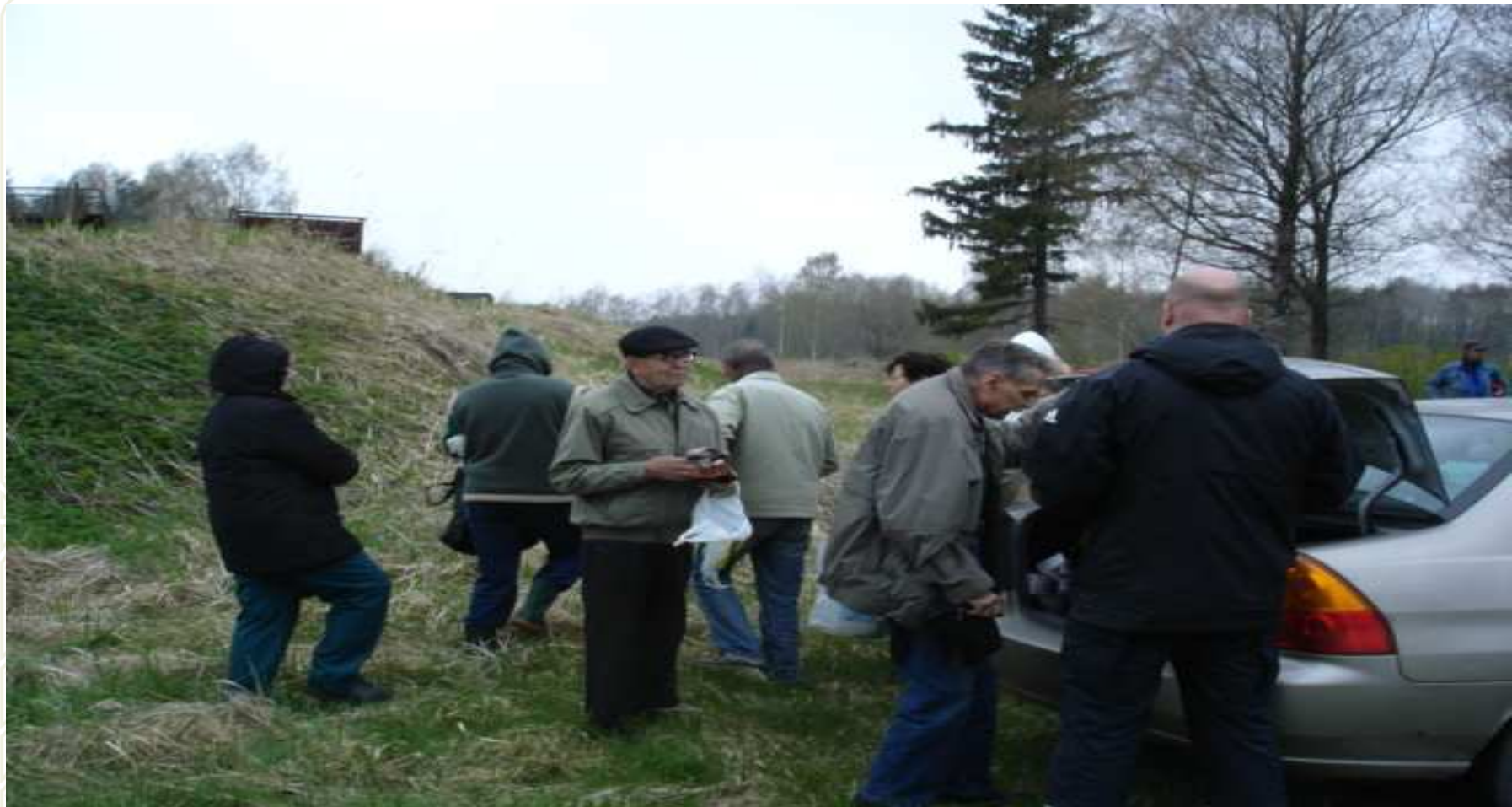
Pildil: "tubakalavka" Pärnumaal, aprill 2012