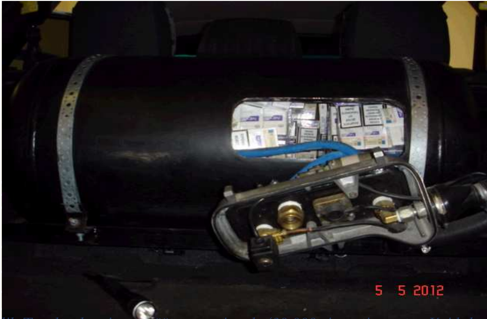
Pildil: Topeltvaheseinaga tootav gaasiseade (80 000 sigareti avastus Koidulas, mai 2012).